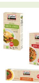
Bio Pasta der Marke Explore Cuisine in 6 Sorten