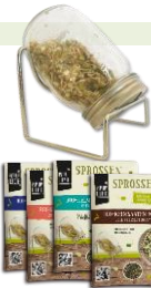
Sprossen in 4 Sorten & Glas