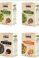
Bio Pasta der Marke Explore Cuisine in 4 Sorten