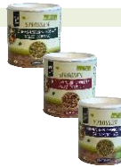
Knusper Sprossen in 3 Sorten